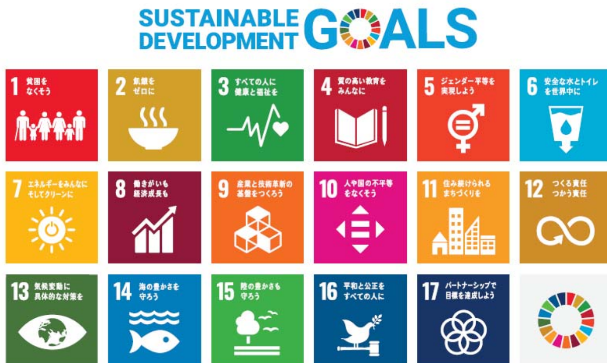
SDG s の目標のアイコンとロゴ

また、平成 27 年（2015 年）に、国連が採択した SDG s（持続可能な開発目標） ※ では、「人や国の不平等をなくそう」「ジェンダー平等を実現しよう」など 17 の目標を掲げ、「人権尊重」を大きな柱としています。SDG s を定めた「我々の世界を変革する：持続可能な開発のための 2030 アジェンダ」の前文でも、「誰一人取り残さない」「すべての人々の人権を実現する」と宣言されており、人権尊重の理念が基礎にあることを示しています。